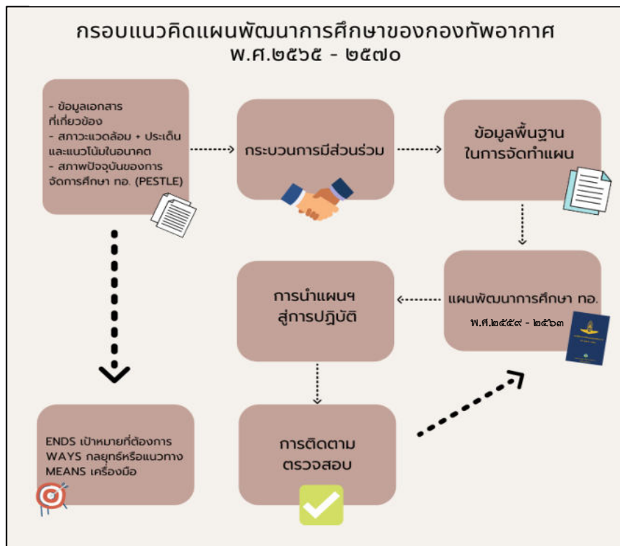
รูปภาพกรอบแนวคิดแผนพัฒนาการศึกษาของกองทัพอากาศ พ.ศ.๒๕๖๖ - ๒๕๗๐

การวิเคราะห์ปัจจัยภายใน ของการจัดการศึกษาของกองทัพอากาศโดยประยุกต์ใช้หลักการของ Balanced Scorecard (BSC) ได้แก่ มิติผู้รับบริการและผู้มีส่วนได้ส่วนเสียและมิติคุณภาพ (Customer Dimension)