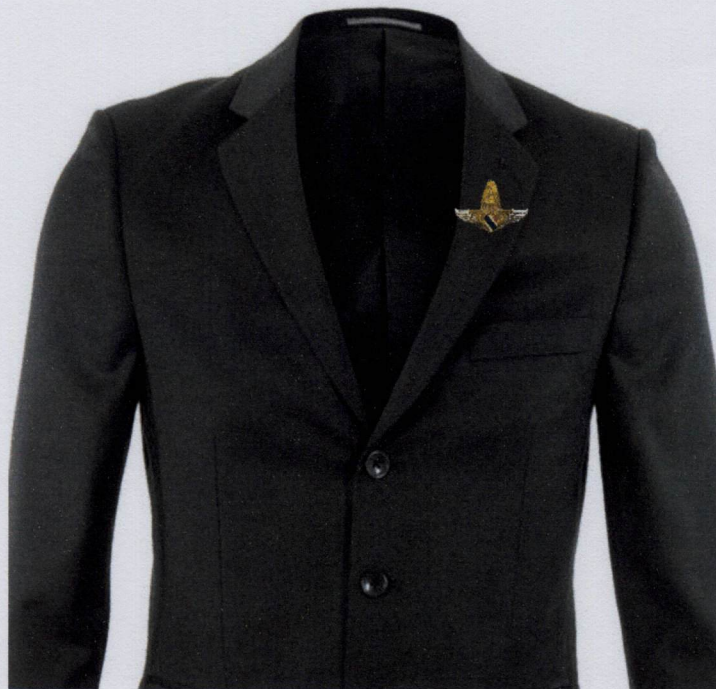
(ขนาดย่อส่วน)