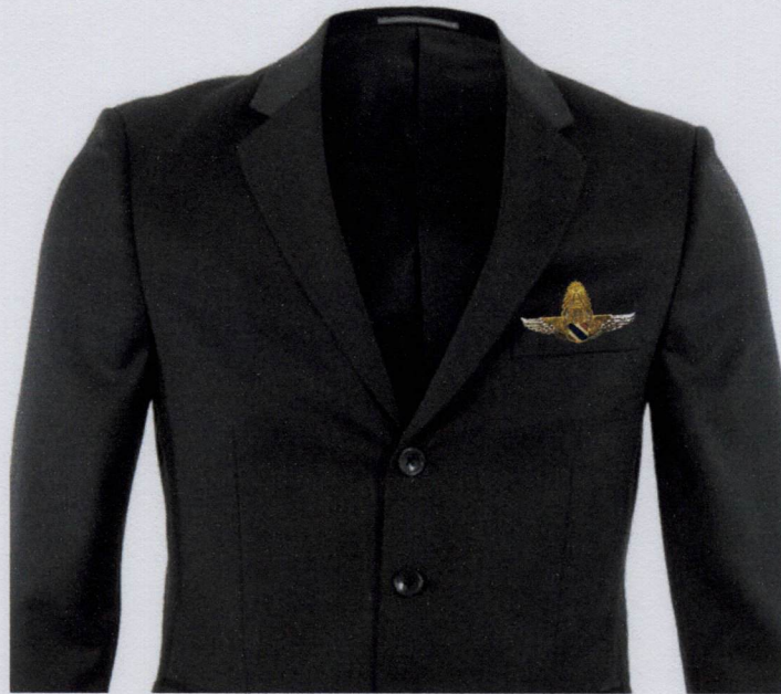
(ขนาดมาตรฐาน)